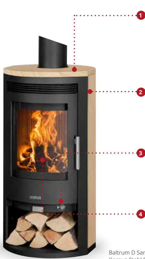
Baltrum D Sandstein, Korpus Stahl Schwarz