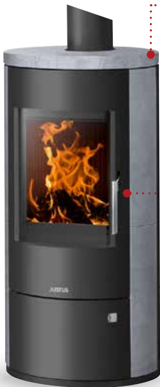
Austin 5 Speckstein, Korpus Stahl Schwarz